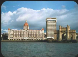
Taj Mahal Hotel, Mumbai