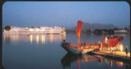
Taj Lake Palace, Udaipur