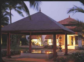
Taj Exotica, Goa

Предлагаемый маршрут – Все наши туры частные, отправление ежедневно. Тур может быть подобран и изменен согласно интересам и расписанию клиентов. Программа, описанная ниже, является примерной, предлагаемым планом путешествия. Будем рады вашим индивидуальным предложениям по туру.