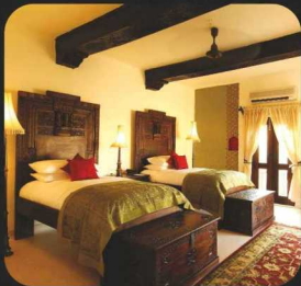
Mihirgarh Rohet, Jodhpur