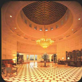
Amar Vilas, Agra