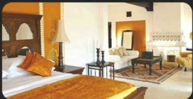
Mihirgarh Rohet, Jodhpur