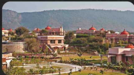
Tree of Life, Jaipur